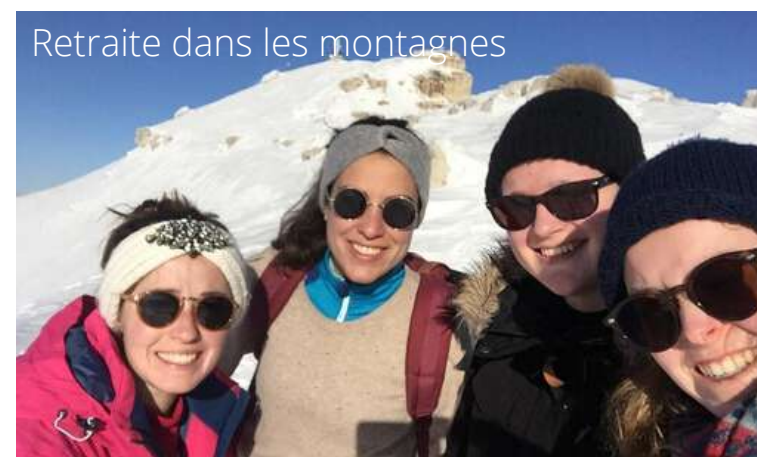
Retraite dans les montagnes