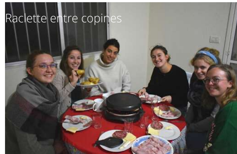
Raclette entre copines