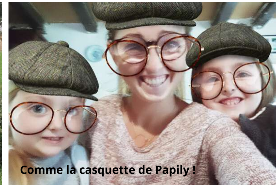
Comme la casquette de Papily !