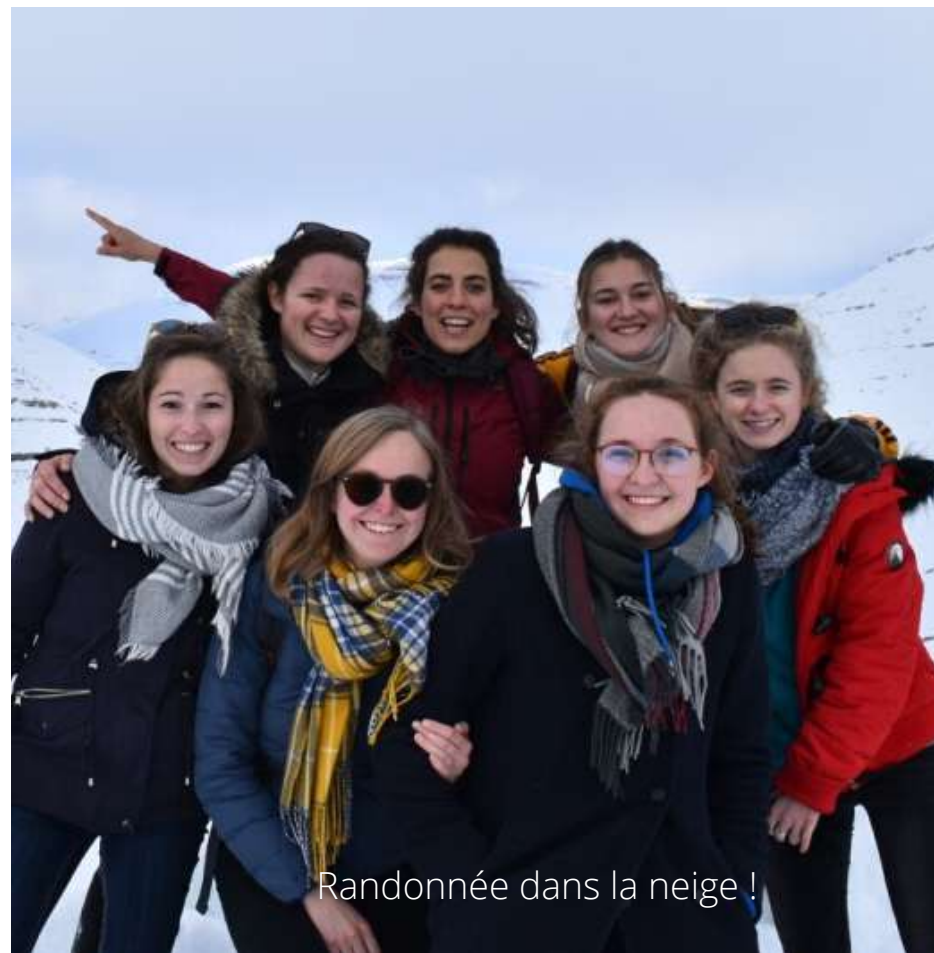
Randonnée dans la neige !