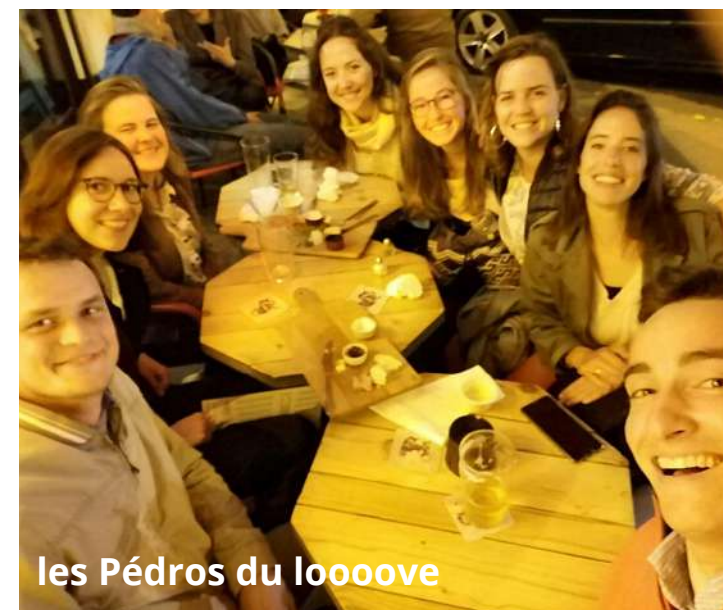
les Pédros du loooove