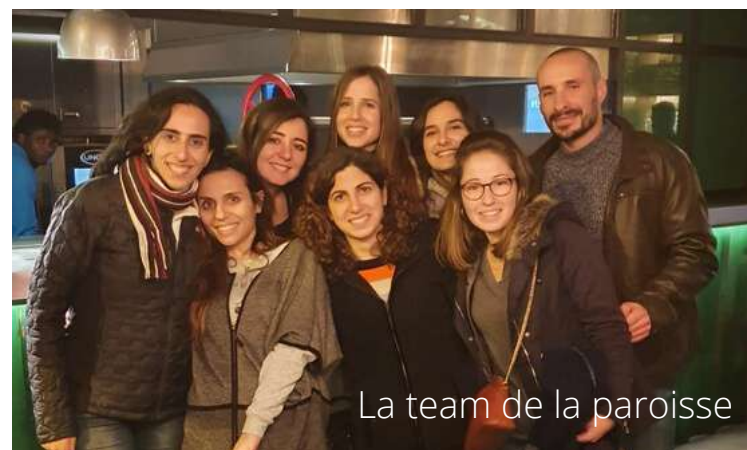
La team de la paroisse