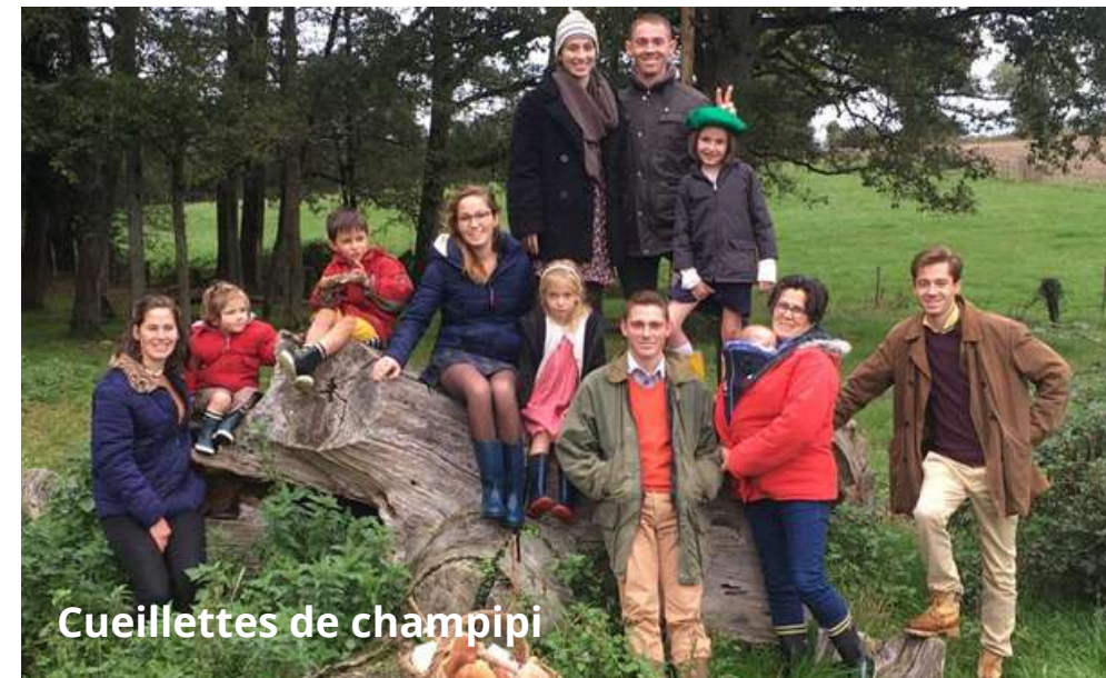
Cueillettes de champipi